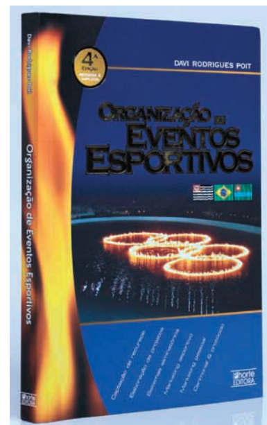
ORGANIZAÇÃO DE EVENTOS ESPORTIVOS Autor: Davi Rodrigues Poit Editora: Phorte Editora – São Paulo – 2007. Páginas: 222

Diz o autor Davi Rodrigues Poit: “Quando as pessoas vão assistir ou